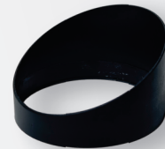
ANTEPARO ANTI OFUSCAMENTO