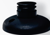
BASE DE FIXAÇÃO