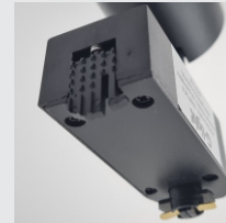
TRAVA DE SEGURANÇA MODELO PRETO