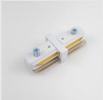
CONECTOR TIPO "I" NA COR BRANCA