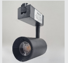
SPOT DISPONÍVEL P/ VENDA - PRETO 676.26.0074 - 3000K 676.26.0076 - 6500K