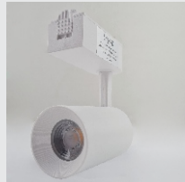
SPOT DISPONÍVEL P/ VENDA - BRANCO 676.26.0071 - 3000K 676.26.0073 - 6500K