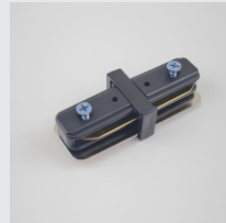
CONECTOR TIPO "I" NA COR PRETA