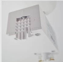
TRAVA DE SEGURANÇA MODELO BRANCO